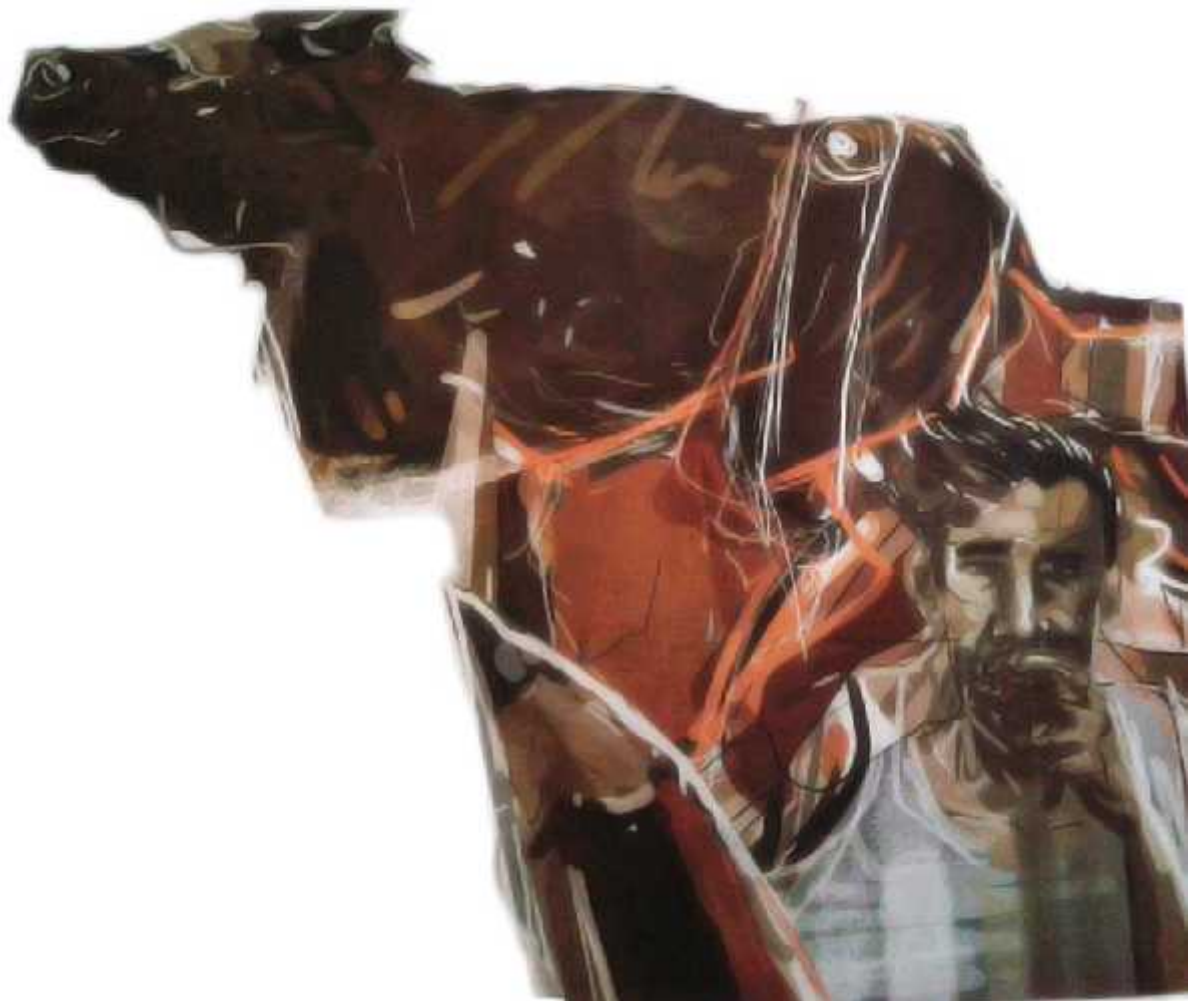
Ilustrasi: Bagus / Jawa Pos