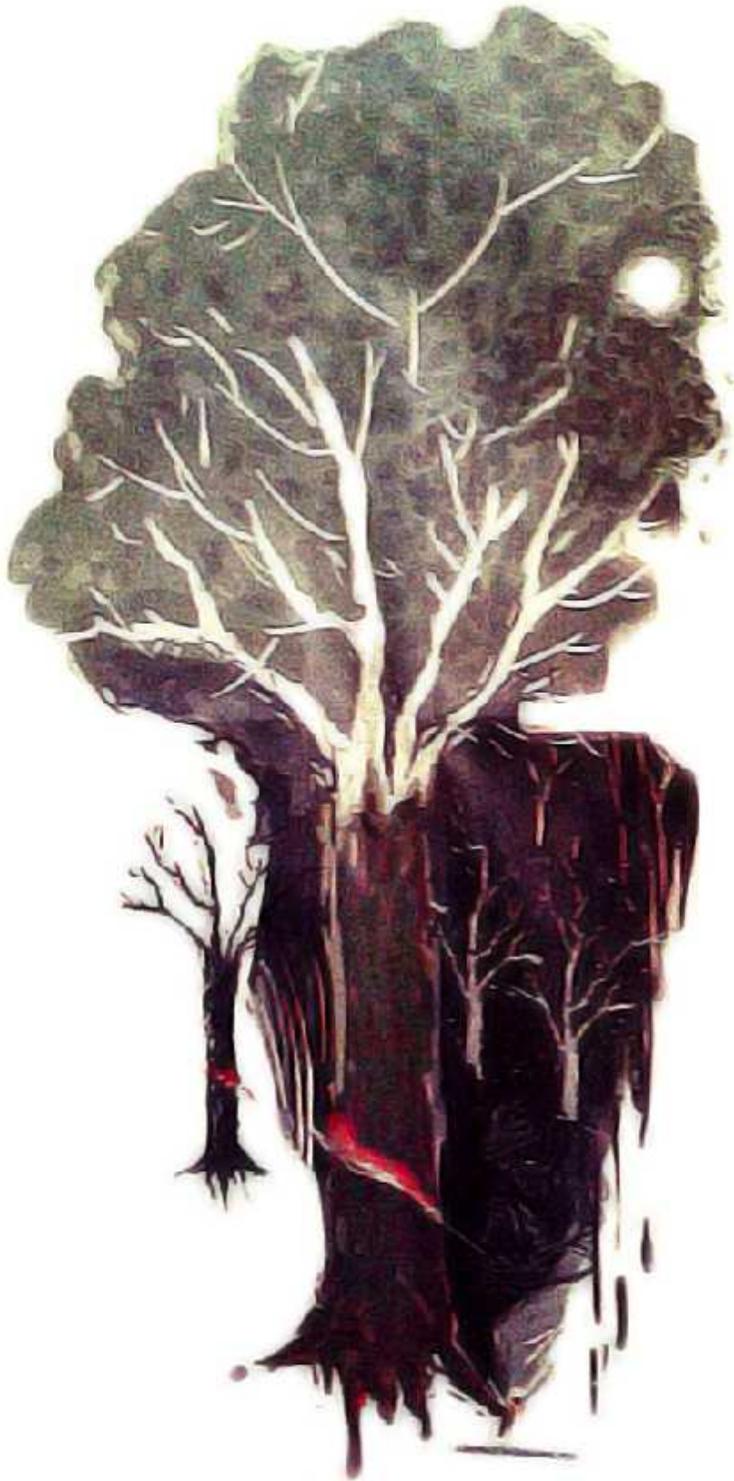
Ilustrasi: Bagus / Jawa Pos