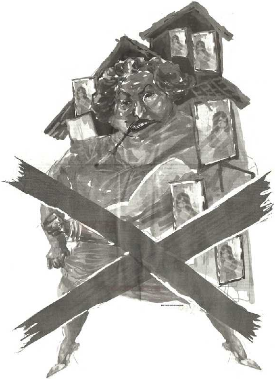
Ilustrasi: Bagus / Jawa Pos