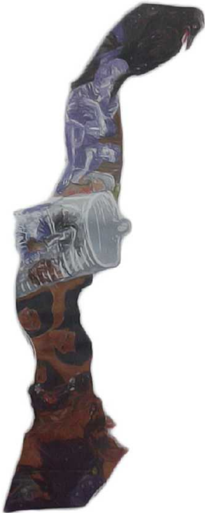
Ilustrasi: Bagus / Jawa Pos