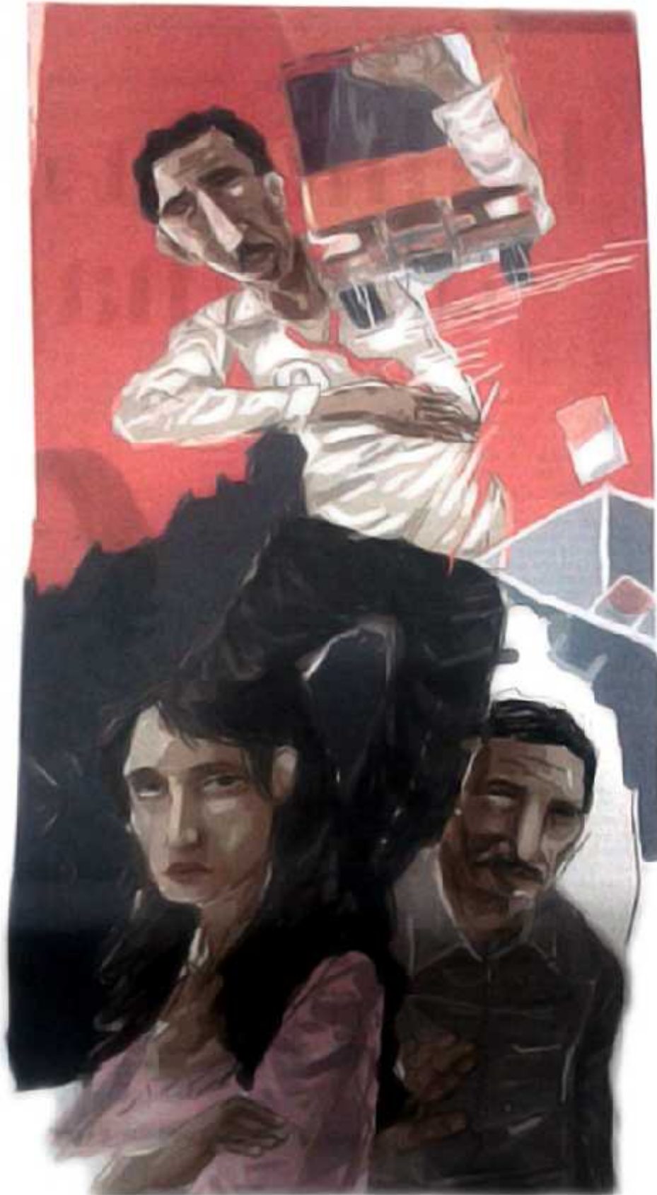
Ilustrasi: Bagus / Jawa Pos