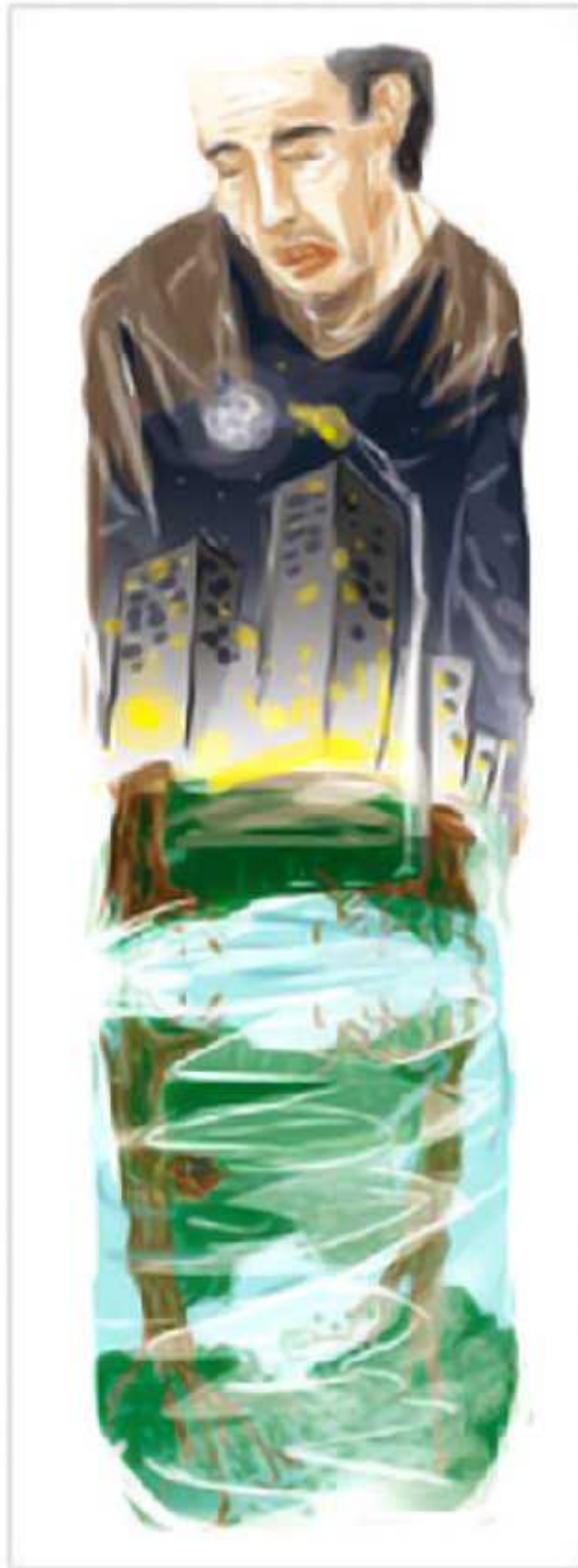
Ilustrasi: Bagus / Jawa Pos