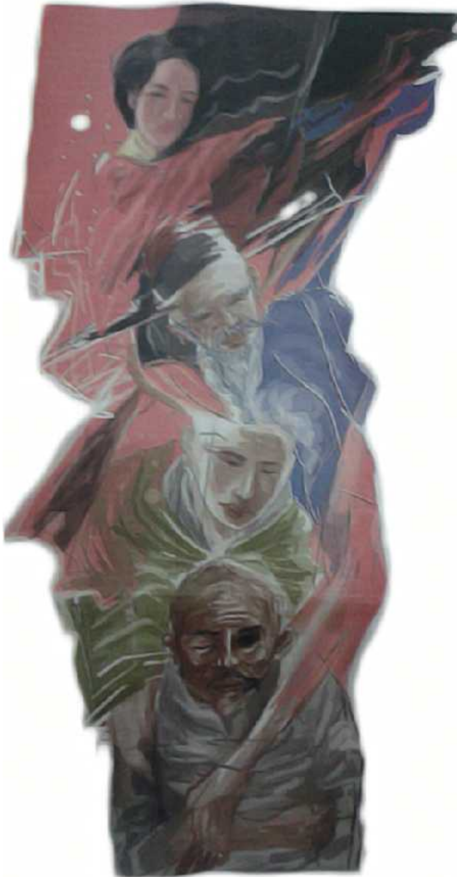
Ilustrasi: Bagus / Jawa Pos