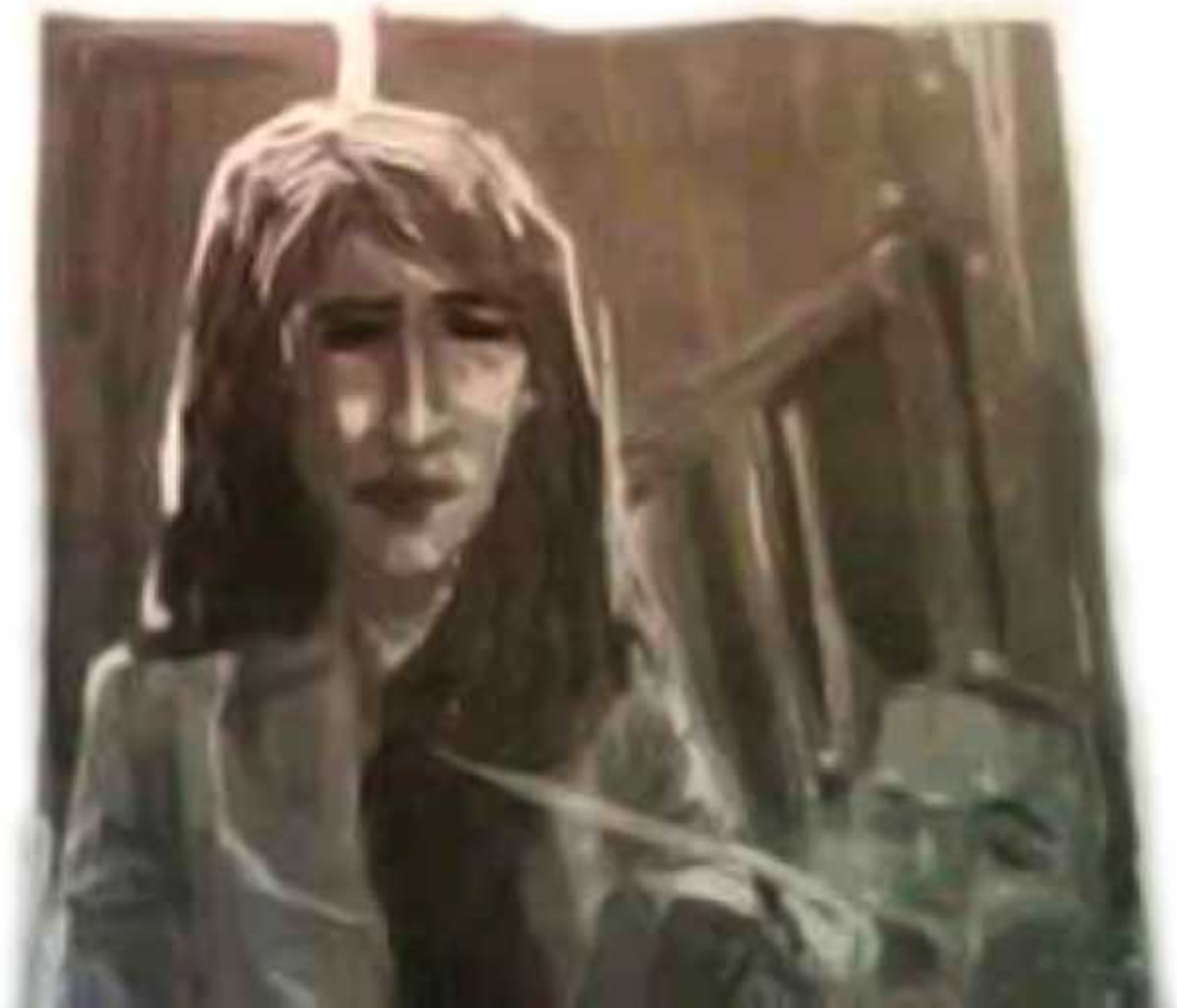
Ilustrasi: Bagus / Jawa Pos