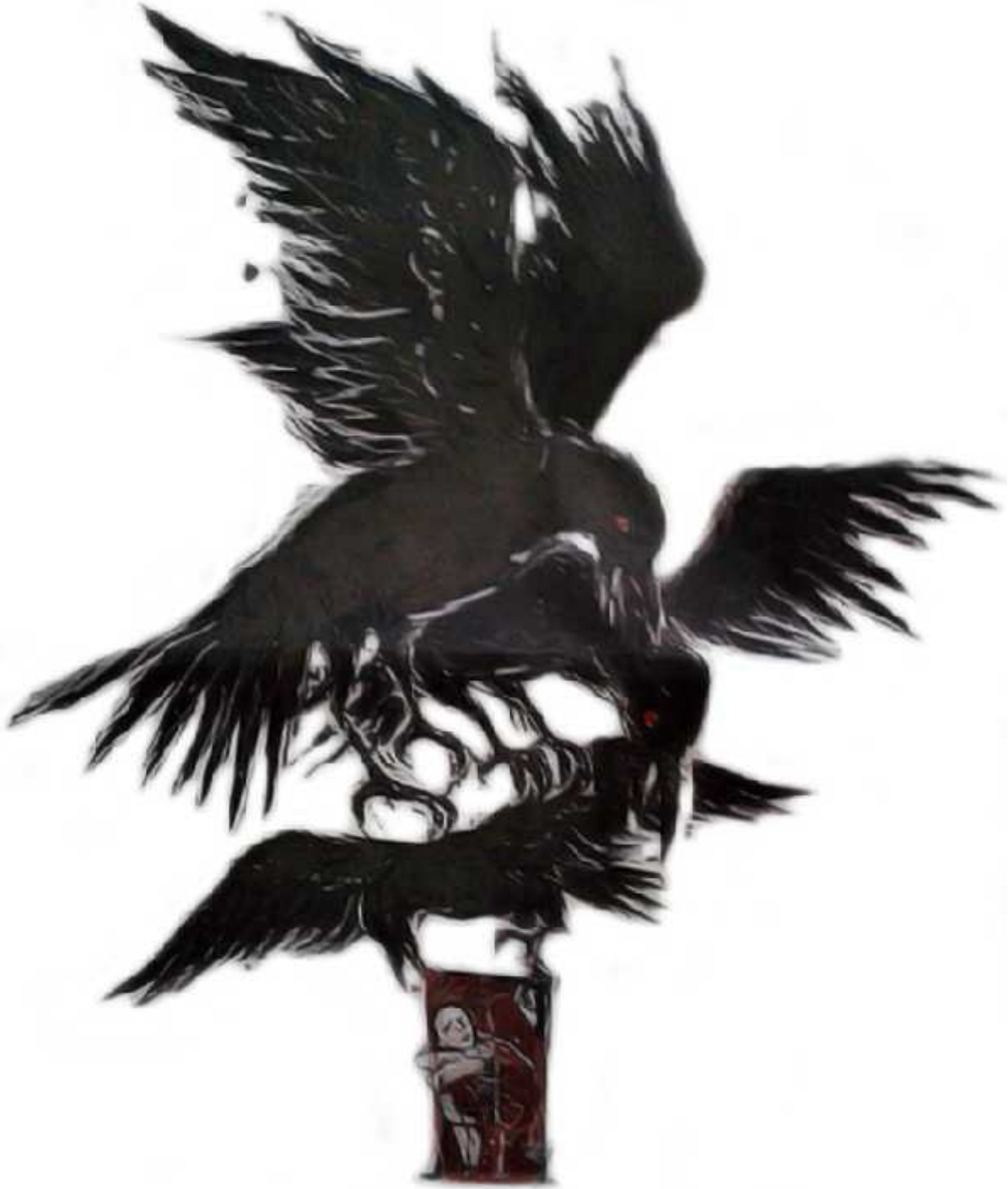
Ilustrasi: Bagus / Jawa Pos