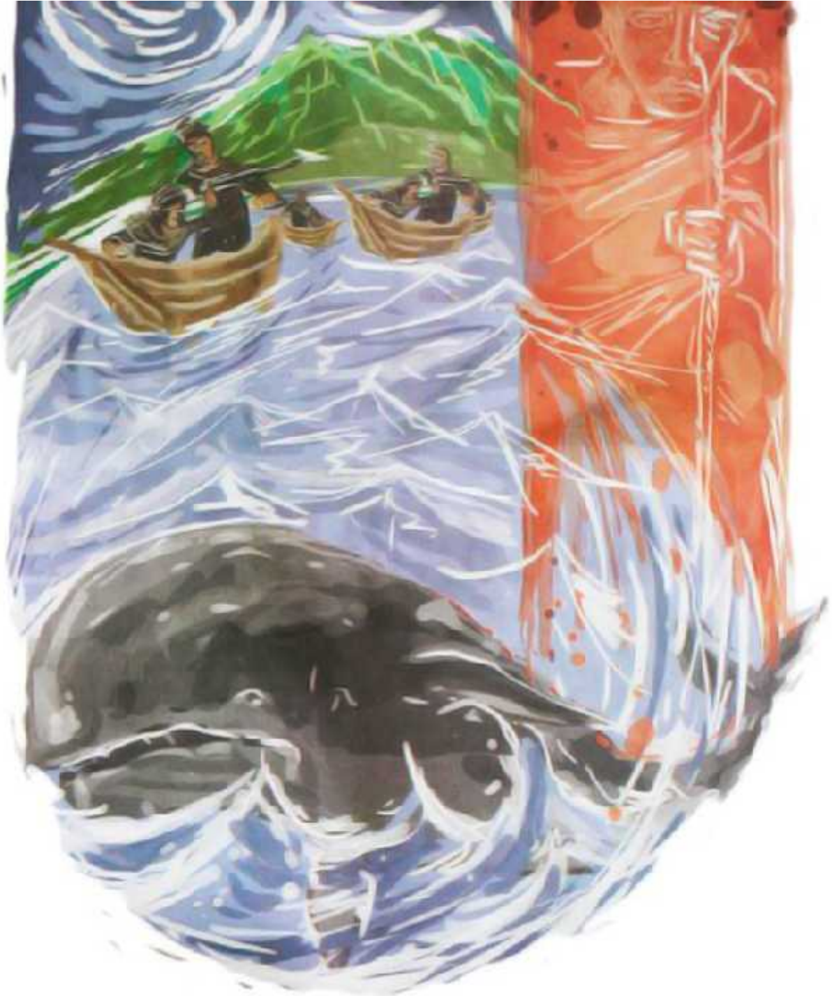
Ilustrasi: Bagus / Jawa Pos