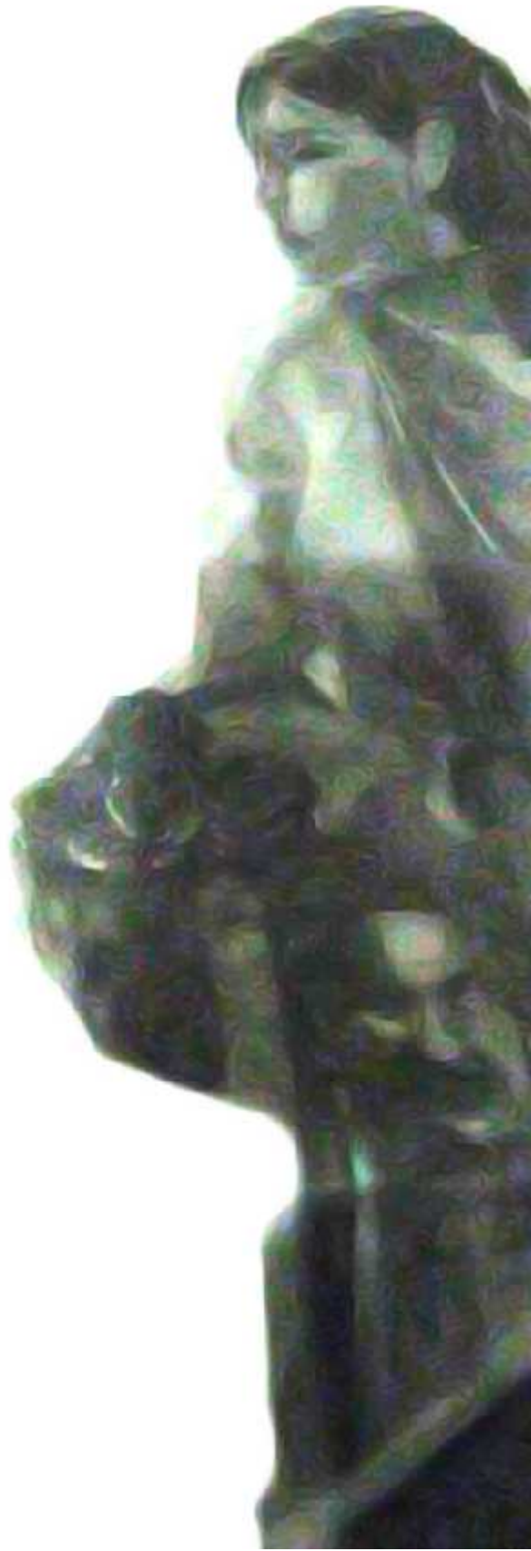
Ilustrasi: Bagus / Jawa Pos