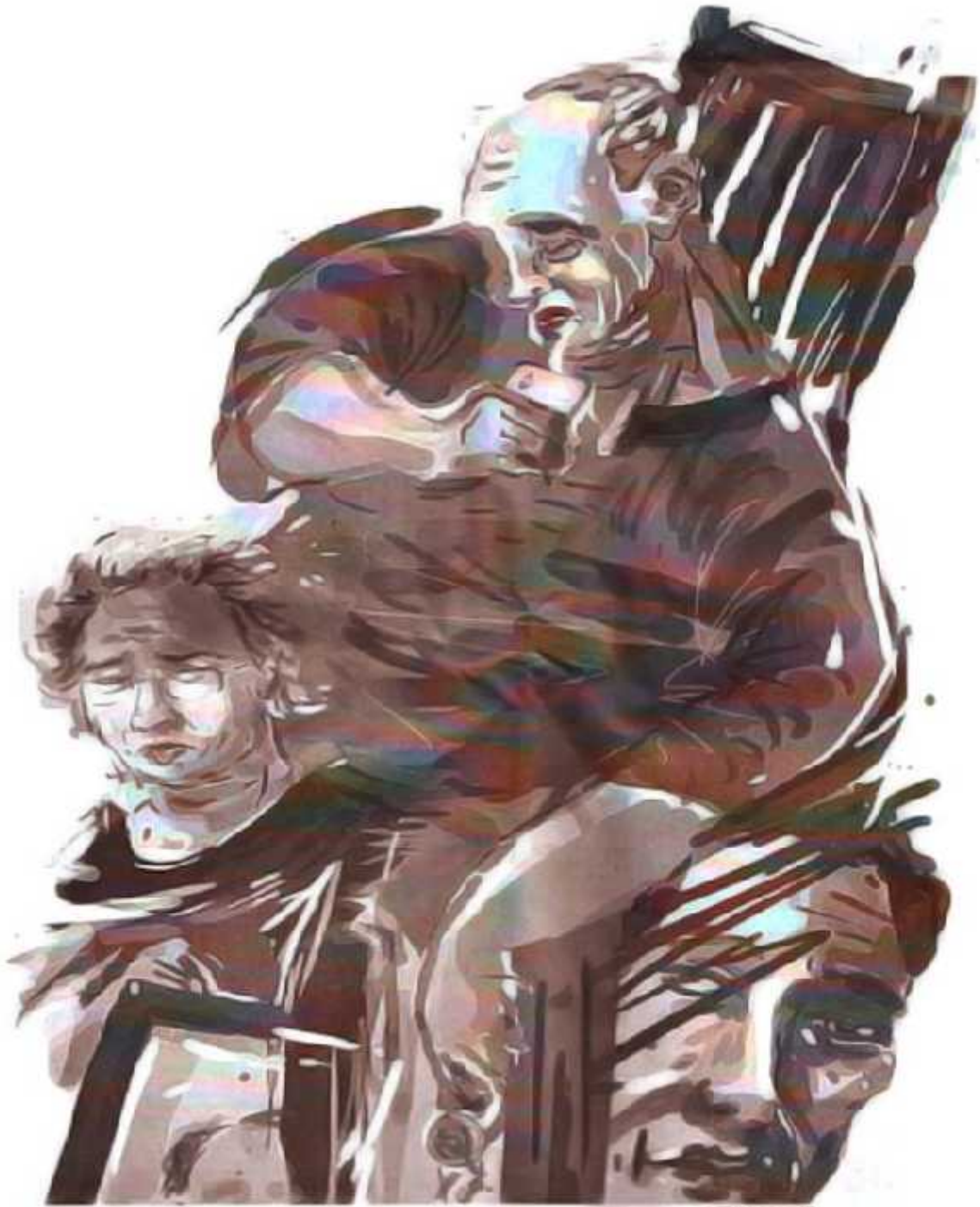
Ilustrasi: Bagus / Jawa Pos