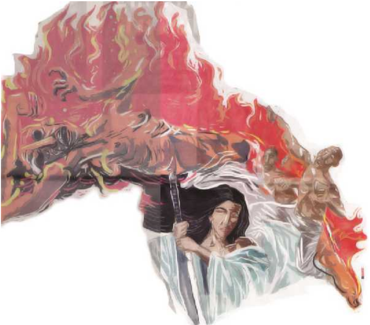
Ilustrasi: Herjaka / Jawa Pos