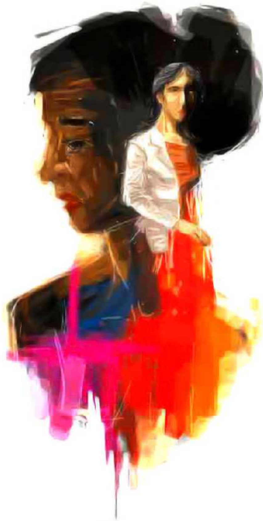
Ilustrasi: Bagus / Jawa Pos