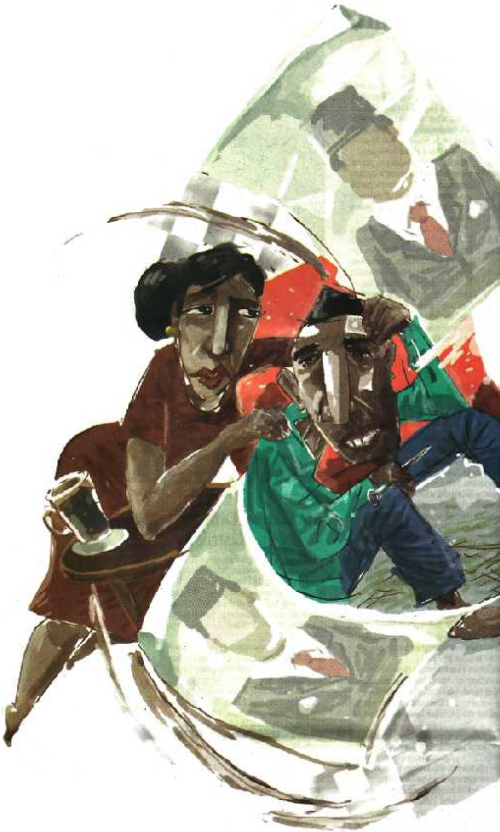
Ilustrasi: Bagus / Jawa Pos