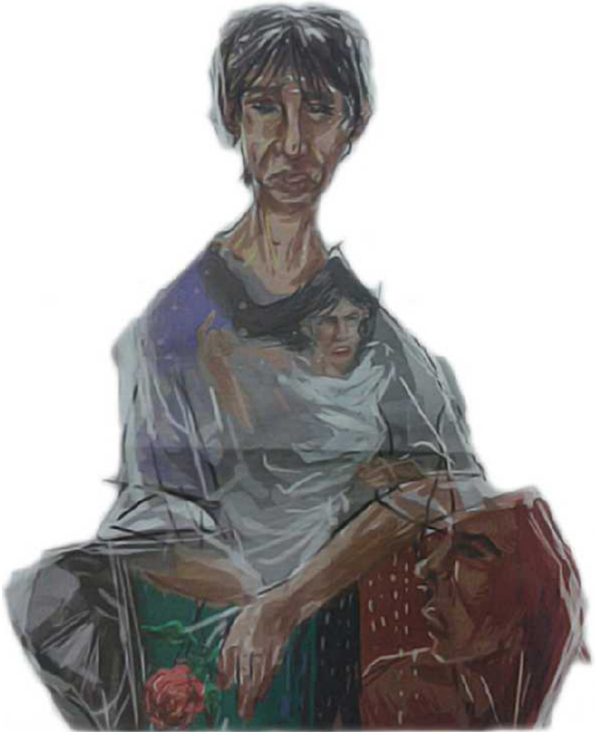
Ilustrasi: Bagus / Jawa Pos