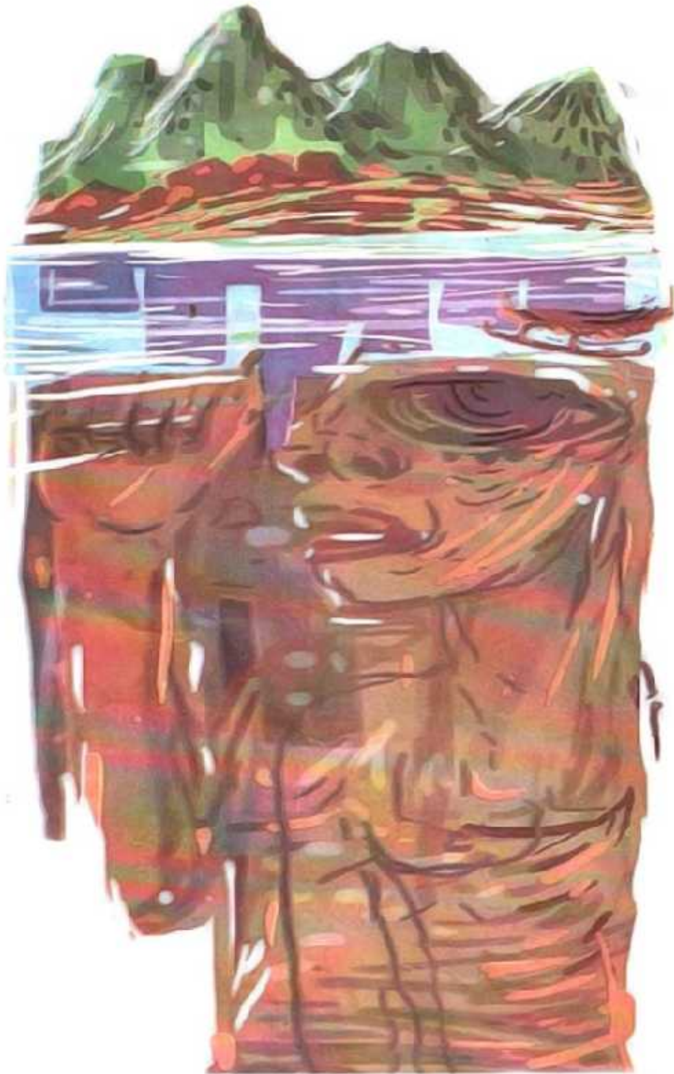
Ilustrasi: Bagus / Jawa Pos