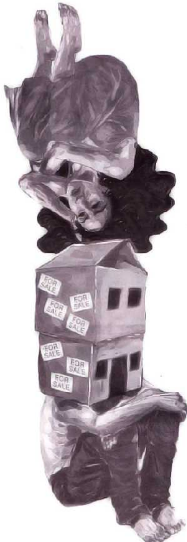
Ilustrasi: Bagus / Jawa Pos

DIJUAL RUMAH DUA LANTAI BESERTA SELURUH KENANGAN DI DALAMNYA