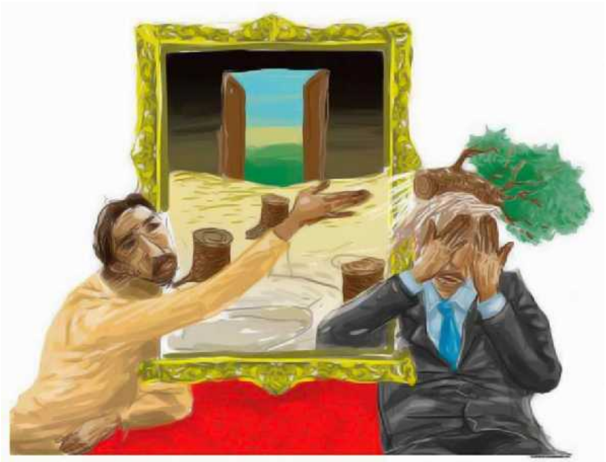
Ilustrasi: Bagus / Jawa Pos