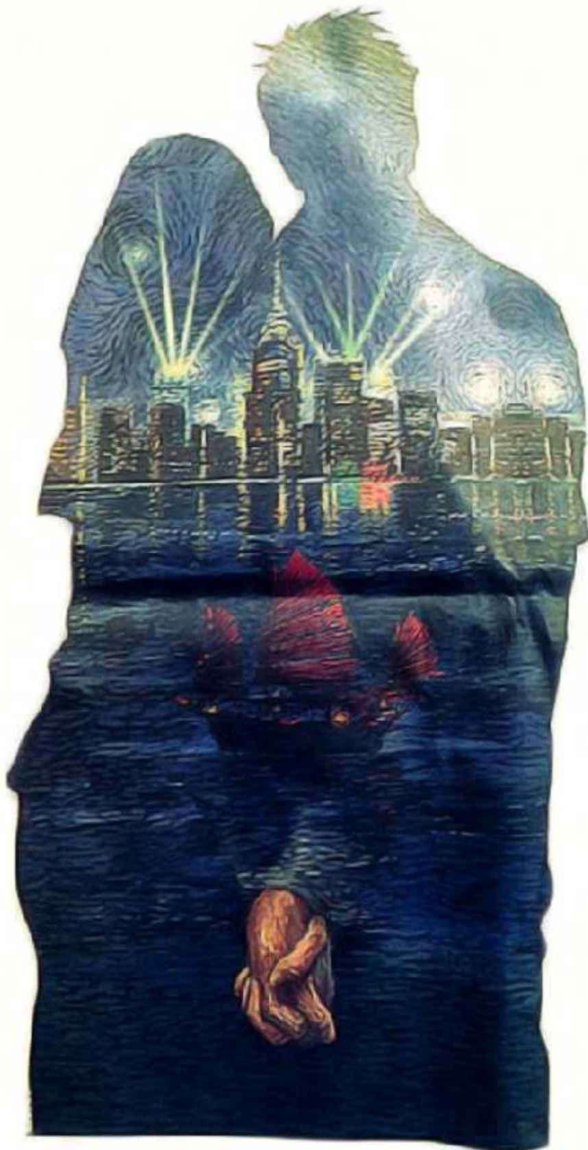
Ilustrasi: Bagus / Jawa Pos