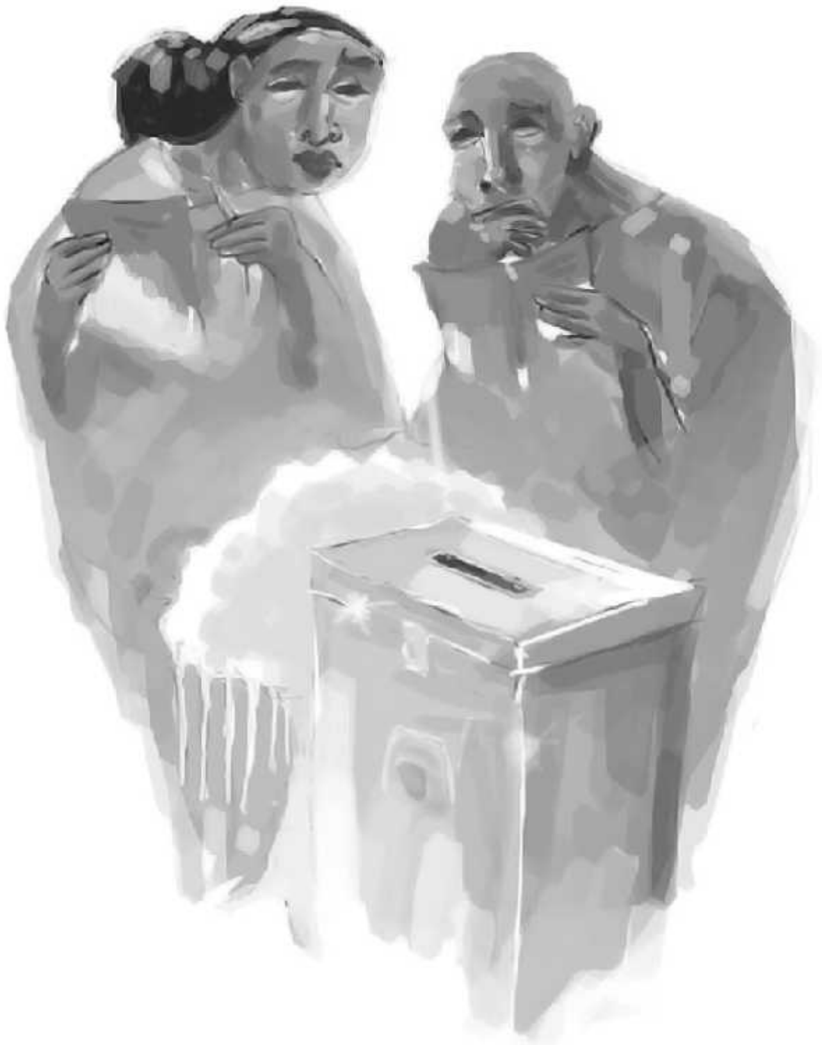
Ilustrasi: Bagus / Jawa Pos